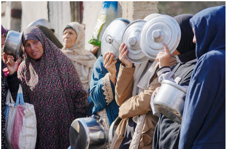
Vrouwen wachten bij een gaarkeuken op eten