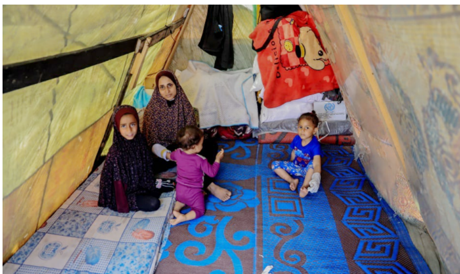
Leven in Gaza is nu overleven in een tent

Stress, angst en voortdurende vrees beïnvloeden