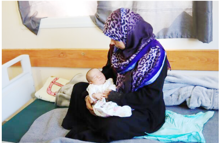
Baby's zijn extreem kwetsbaar door gebrek aan voedsel en medische zorg

rechtstreeks de hormonen die de menstruatie reguleren. Het lichaam produceert meer cortisol en adrenaline, wat de hormonale balans verstoort. In Gaza leven vrouwen en meisjes onder constante psychische druk, wat leidt tot vertraagde, onregelmatige of uitblijvende menstruatie. Het lichaam beschouwt stress als een bedreiging voor overleving en schakelt niet-essentiële functies tijdelijk uit.