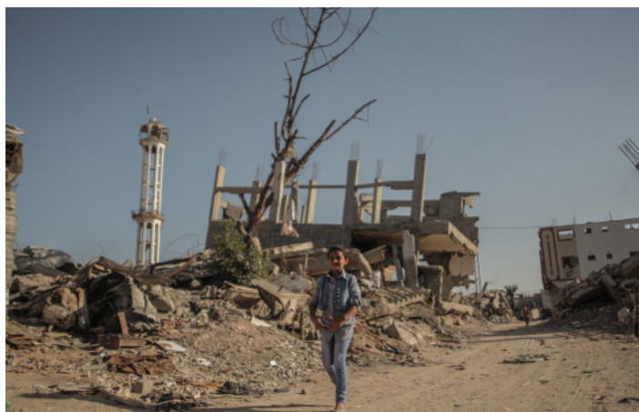
Verwoestingen in Shujaiya een wijk in Gaza-stad

Het scherpe contrast tussen deze beelden geeft de realiteit van het leven in Gaza weer. Ezz kiest ervoor om naast de gruwelijkheden en trauma's ook het dagelijkse leven te laten zien. Ondanks de moeilijke