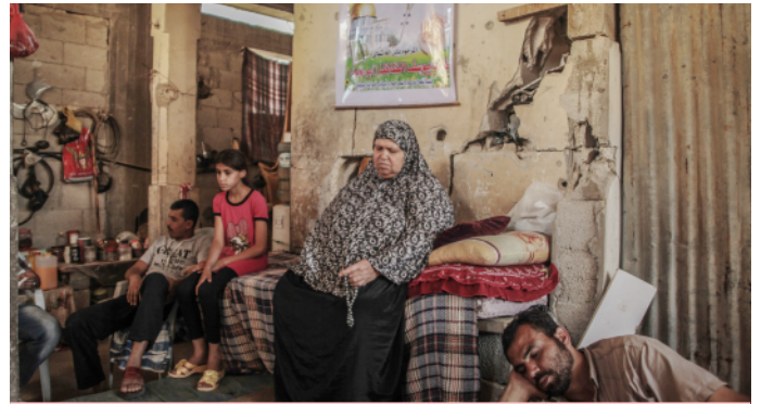
Verwoestingen in Shujaiya een wijk in Gaza-stad

En dat terwijl Gaza oorspronkelijk een heel rijk gebied was met nauwelijks armoede omdat het